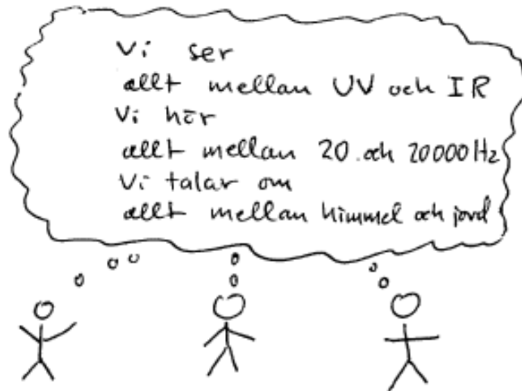
Det biologiska perspektivet

Genom att t ex noggrant observera hur våra hörsel- och talorgan är uppbyggda biologiskt, har man kunnat utveckla hjälpmedel och träningsprogram för människor som fått skador i dessa organ.