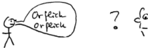
Om behovet av grammatik

I alla språk finns en grammatik som anger en sorts ordningsregler för hur ord och morfem får användas tillsammans. Om vi vill uttrycka en viss betydelse kräver detta för det första att de morfem vi valt motsvarar vad vi vill uttrycka, för det andra att morfemen kommer i rätt ordning och för det tredje att inga relevanta morfem utelämnas och inga irrelevanta morfem inkluderas. Jag satt bilen och Jag hade satt i bilen är inte grammatiskt lyckade uttryck för att säga Jag satt i bilen . Med hjälp av grammatiken blir det möjligt för oss att få en relativt exakt innebörd även i komplexa betydelsesammanhang, något som sedan kan utnyttjas för att överföra och lagra komplexa typer av information.