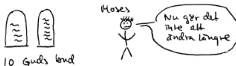
Om skriftspråkets konsekvenser.

Om författaren är anonym eller skriften omges av en mystisk, religiös prägel, vilket relativt ofta varit fallet under de tusental år skriftsystem varit i bruk, kan den skriftliga informationen tom komma att framstå som fakta som är viktigare än den för sinnena tolkningsbara omvärlden. Tänk bara på den roll skrifter som Bibeln och Koranen har spelat och fortfarande spelar för mänskligt beteende. Vill man ha exempel av modernare ursprung kan man fundera på i vilken utsträckning nutida lagstiftning och vetenskap hade varit möjliga utan stöd och kodifiering med hjälp av skriftsystem.