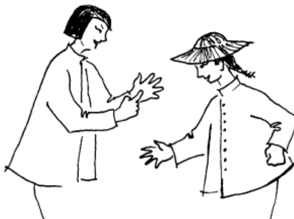
Figur 1.2 Kineser med olika dialekt som ritar tecken i handflatan för att förstå varandra.

Ett språks användning eller funktion reflekteras också i ord som klarspråk, maktspråk och kärlekens språk, där man kan se att anledningarna till beteckningarna är att språket används på ett visst sätt i ett visst syfte eller med en viss funktion.